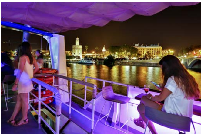
Vista de la Torre del Oro desde el barco. View of the Torre del Oro from the ship.