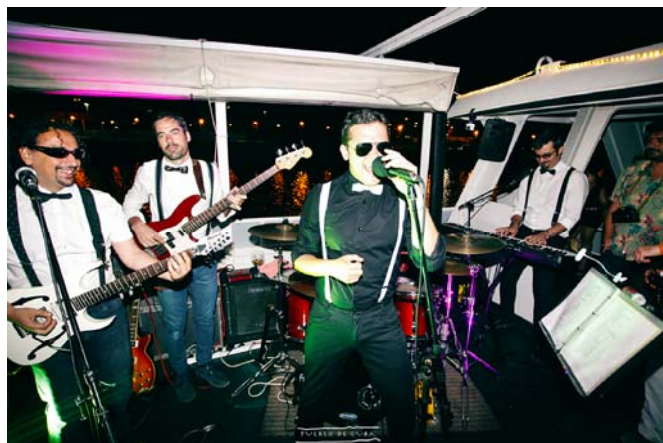
Actuación en el barco. Acting on the ship.