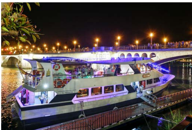
El barco en el embarcadero. The ship at the pier.