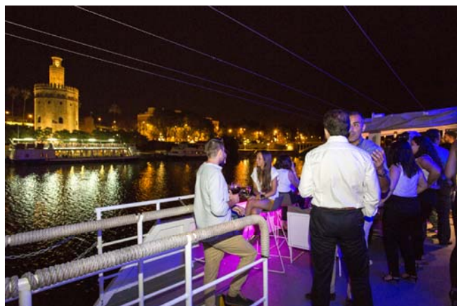
Vista de la Torre del Oro desde el barco. View of the Torre del Oro from the ship.