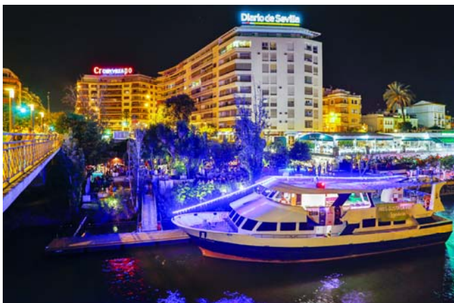
Vista del barco y de Puerto de Cuba desde el Puente de San Telmo. View of the ship and the Puerto de Cuba from bridge of San Telmo.