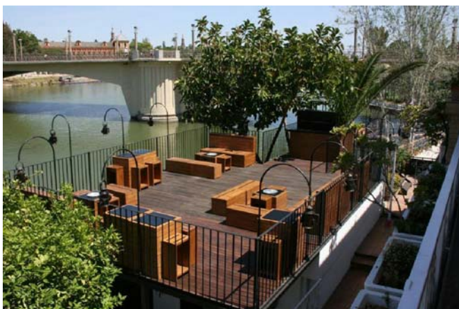
Vista diurna de la terraza mirador. Daytime view of the terrace viewpoint.