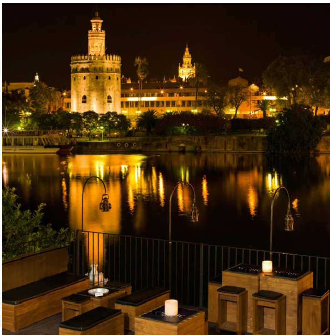
Vista nocturna de la Torre del Oro desde la terraza mirador. Night view of the Torre del Oro from the terrace viewpoint.