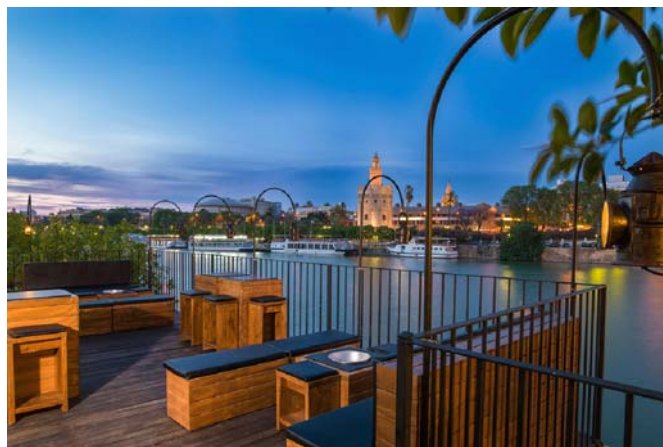
Vista al anochecer de la Torre del Oro desde la terraza mirador. Evening view of the Torre del Oro from the terrace viewpoint.